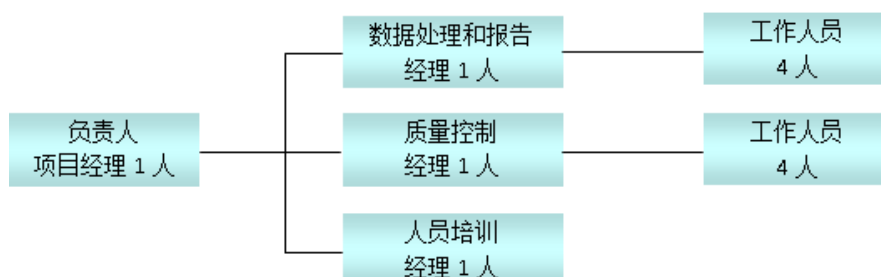
图 2 监测活动系统组织结构

其中，项目经理负责整个监测活动的实施和监督；定期培训监测系统的员工；负责项目的联络工作。